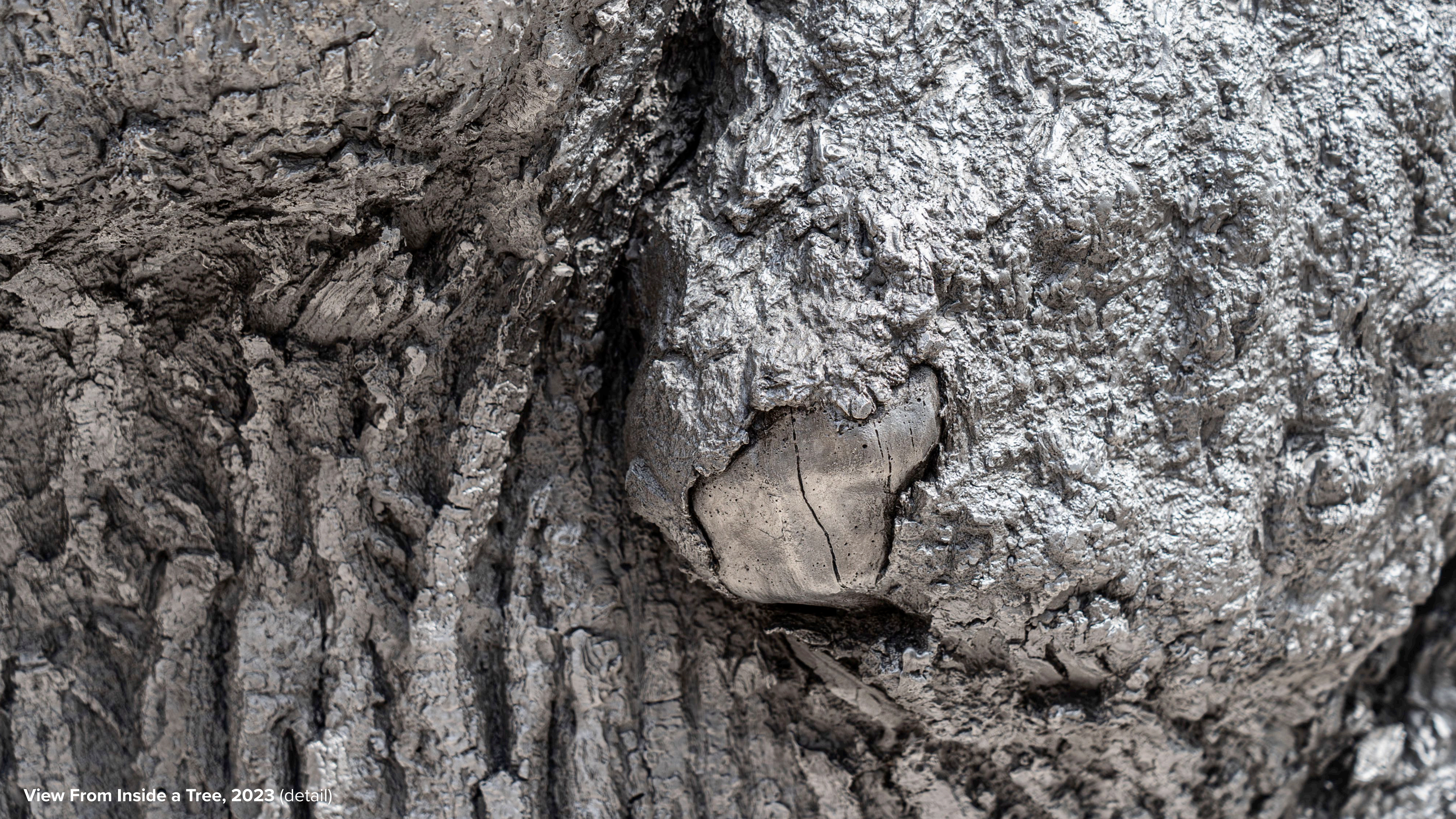
View From Inside a Tree, 2023 (detail)